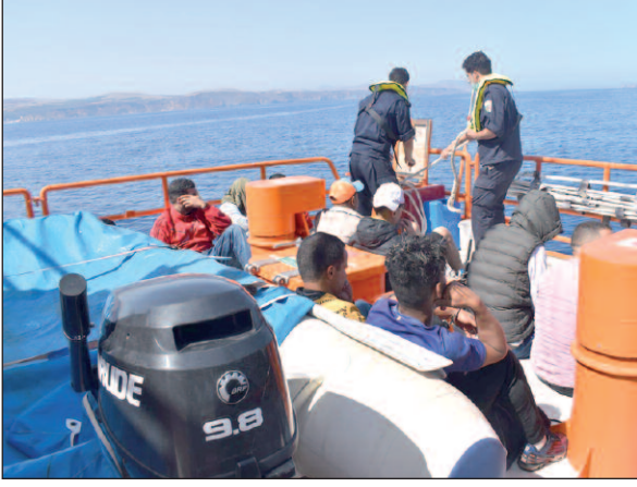
البنزين، وعند التحقيق معهم، تبين أنهم كانوا يعدون لمغادرة التراب الوطني بصفة غير شرعية، انطلاقا من شاطئ

«الإخوة الثلاثة»، لبيقي المدبر الرئيسي للرحلة في حالة فرار. وعن تهم التدبير والتنظيم للخروج غير المشروع من التراب الوطني عبر البحر، قدم سالفو الذكر أمام وكيل الجمهورية لدى محكمة مستغانم، وبعد إحالة الملف على قاضي جلسة المثول الفوري بنفس المحكمة، أصدر في حقهم غرامة مالية قدرها 20 ألف دينار نافذة للشخص الواحد مع الإفراج، فيما تبقى الأبحاث جارية بشأن المتهم والمدبر الرئيسي لعملية الهجرة السرية إلى غاية توقيفه وتقديمه أمام النيابة.