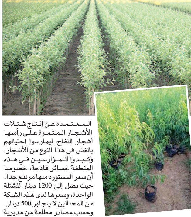
مسؤوليتها كاملة في ظهور أصحاب مشاتل مزيفين استغلوا توقف المشاتل

مشكلة مصرح بها لدى المعهد الوطني لمراقبة البذور تصرح بمنتوجها، فيما تشكل المشاتل الفوضوية التي لا تخضع لأي رقابة نسبة 60 إلى 70 من المائة من المشاتل، التي تنشط في إنتاج شتلات الأشجار المثمرة، ما يفسر ظهور شبكات الاحتيال والغش في النوعية على الفلاحين، على الرغم من تشكيل المعهد الوطني لمراقبة البذور لجنة خاصة للمراقبة مكونة من مختصين في المجال، تعمل على مراقبة الشتلات والبذور التي تنتجها المشاتل، وذلك في سبيل المحافظة على النوعية الجيدة من أجل حماية وتحسين الإنتاج، وقصد إضفاء الفعالية على الرقابة فقد تم تشكيل لجان جهوية تعنى بالمتابعة والتفتيش والرقابة والاهتمام بالمشاتل الموجودة في الولايات القريبة منها كاللجنة الموجودة في البلدية، إلا أن نشاطها يظل محدودا وغير فعال مع ظهور شبكات الاحتيال على الفلاحين في إنتاج وتسويق شتلات الأشجار المغشوشة.