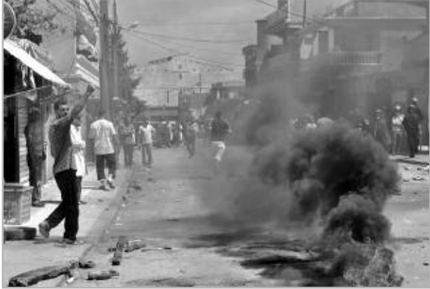
بنورة، 27 أفريل 2011

وتنقل كل من المفتش العام والأمين العام للولاية، أين تم نقل ممثلين عن المحتجين إلى مقر الولاية وأخذ انتشغالهم على محمل الجد وفي هذه الأثناء خرج العشرات من سكان وشباب بنورة وقاموا بإغلاق الطريق الوطني رقم 1 في جانبه المؤدي إلى منطقة سيدي اعياض مما سبب شللا تاما لحركة النقل لولا تدخل عناصر الأمن على وجه السرعة، أين قامت بفتح مسلك اجتبابي وكذا بتنظيم