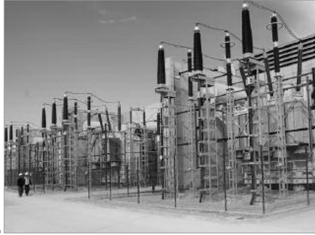
تصوير محمد تيرانس قرين

وأشار الباحث إلى توزيع المشروع على ثلاث مراحل لإنجاز النموذج، ثم تشغيل البرنامج وتعميمه، عن طريق إنجاز وحدات لإنتاج الطاقات المتجددة وتطوير البحث والمؤهلات المحلية بإنتاج 80 من المائة من التجهيزات في التراب الوطني وتكوين المؤسسات الصغيرة والمتوسطة، وترقية المشروع الألماني "ديزارتك" لتطوير الطاقات المتجددة في دول حوض البحر الأبيض المتوسط لإنتاج الكهرباء وتصديرها للدول الأوروبية في حدود 50 سنة. إضافة إلى المشروع الثاني الفرنسي "تيرانس قرين" لنقل الكهرباء