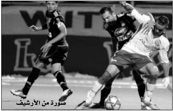
صورة من الأرشيف

الأولى فرضت عناصر الوفاق سيطرة مع البداية ليستفيد بن موسى من مخالفة في 56د تصطدم بالقائم يخرجها الدفاع بين أرجل عزالي الذي تعرض للعرقلة على خط 18 م نفذها بن موسى وأخرجها الدفاع إلى بن شادي بفتحة تجاه عودية وجها لوجه في 58د يسجل الهدف الثاني والثامن لحسابه، يرد بوعزة في 68د بفتحة في القائم الثاني إلى حميتي يمرر إلى جدياتي يستغل خطأ الحارس بلخوجة مسجلا هدف التعادل ليتواصل اللقاء إلى غاية الثانية الأخيرة من الوقت بدل الضائع، حيث أعلن الحكم بنوزة ركلة جزاء بسبب لمس المدافع شافي الكرة باليد نفذها بن موسى موقعا هدف الفوز لفريقه ومتوجا فريه بطلا شتويا موازاة مع طرد المدافع ديس بسبب مناوشاته مع العيادي، وقد عرفته مدينة سطيف مباشرة بعد نهاية المباراة إعلان الاحتفالات من خلال تجمع المشجود وسط المدينة وتعالى أصوات منبهات السيارات.