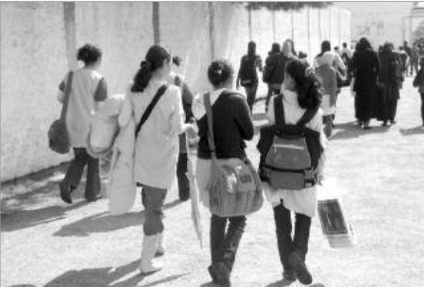
إسمهان - ز

ستقوم وزارة التربية الوطنية خلال الأسبوع القادم، ببعث مراسلات رسمية إلى جميع مديريات التربية، تنص على ترك حرية التصرف لمدراء المؤسسات التعليمية من أجل تخصيص جدول زمني خاص قصد استدراك الدروس الضائعة بسبب سوء الأحوال الجوية. وطالبت نقابات التربية بتأخير امتحانات الفصل الثاني إلى الأسبوع الأول من عطلة الربيع .