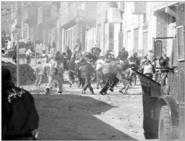
سيارة، في بئر العاتر

في آخر إحصائيات تحصلت عليها "النهار" من الشجار الذي وقع، مساء أول أمس، بين الطائفتين الإياضية والمالكية في مدينة غرداية، على خلفية شجار نشب بين تلاميذ ثانوية مفدي زكرياء، ليتطور الوضع إلى التراشق بالحجارة فوق الجبل الواقع بين حي بني يزقن وثنية المخزن.