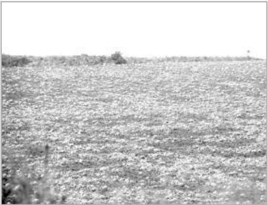
صورة التقطت من الجو

الوزراء يوم 22 من شهر فيفري عام 2011، وكشف المتحدث عن تحديد 7 آلاف و700 هكتار بولاية تمنراست تم الإعلان عن مناقصات بشأنها للإستثمار فيها، مؤكدا في هذا الصدد أن الدراسات التي أجريت حول هذه الأراضي تفيد بأنها صالحة لغرس النخيل وزراعة الخس والफल، وعن تحديد 12 ألف