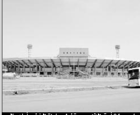
ملعب 04 أوت الذي سيحتضن مباراة الخضر أمام مالي

أعلن الاتحاد الدولي لكرة القدم "فيفا"، أمس، عن تأخير لقاء مالي أمام المنتخب الوطني الجزائري، المقرر الأسبوع المقبل، ضمن ثاني مباريات "الخضر" في تصفيات إفريقيا المؤهلة لمونديال البرازيل 2014 بـ24 ساعة ليبرمج رسميا يوم الأحد 10 جوان بملاعب 4 أوت بعاصمة بوركينافاسو واقادوفو ابتداءً من الساعة