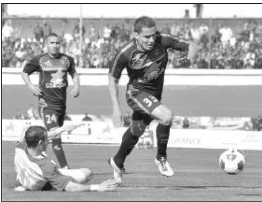
المدينة لتشجيعهم على تمويل فرق المدينة الثلاث، حيث من المنتظر أن يجري هذا الاجتماع صبيحة الغد ببنقند وسط المدينة، إذ سيحضره مسؤولو النوادي الثلاثة، شباب ومولودية قسنطينة وجمعية الخروب، وجاءت خطوة الوالي هذه في ظل عدم شروع هذه الفرق في عملية الإنتدابات بسبب نقص مصادر التمويل، ويأمل متابعو هذه النوادي أن يثمر الاجتماع بالنجاح من أجل الخروج من الوضعية الكارثية التي تعيشها لاسيما من الناحية المادية.