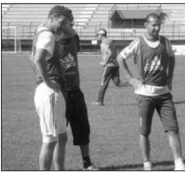
الأساسيين في نهاية عقودهم.