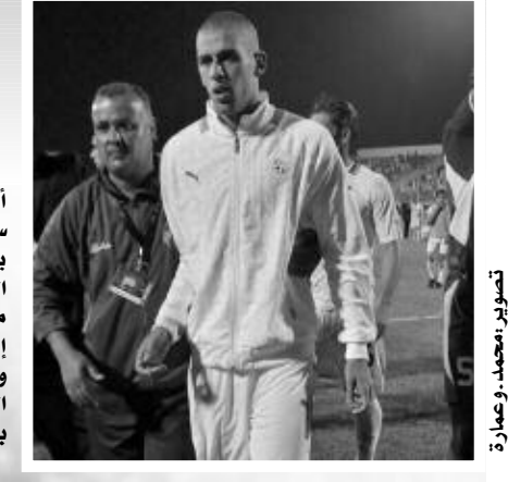
أقر بالتأثير الكبير لهزيمة مالي على المنتخب