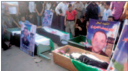
ثلاثة أيام وأدى ذلك إلى سقوط عشرات الضحايا. وأشارت اللجان إلى "نقص في الطواقم الطبية والإسعافات الأولية" في المدينة، مشيرة إلى أن الأهالي وجسوا "نذاعات استغاثة لتأمين المواد"

الطبية لعلاج الجرحى". وأشار إلى استمرار حملة المداومة والاعتقال في منطقة "المزة". وقتل بعد منتصف الليل أيضا ملازم منشق هو قائد إحدى الكتائب الثائرة القتالية ومقاتل من الكتيبة، إثر اشتباكات مع القوات النظامية السورية في محافظة درعا. كما قتل ثلاثة عناصر من القوات النظامية على الأقل في اشتباكات في محافظة "حمص". وأفادت لجان التنسيق المحلية عن قصف صباح السبت، بالرشاشات الثقيلة في مدينة حمص. وأشارت إلى قصف استهدف أيضا محافظة حمص، حيث يسجل انقطاع كامل للتيار الكهربائي والخبز والمواد الغذائية.