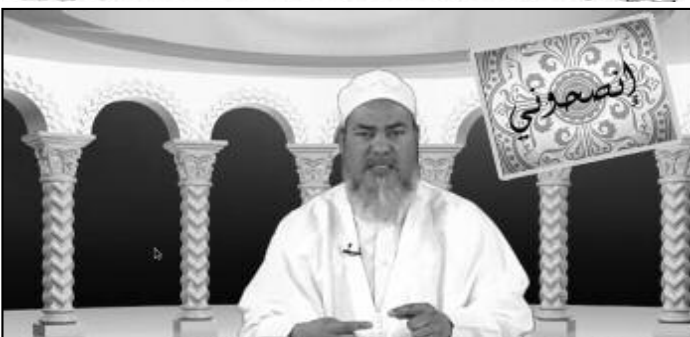
يمكنكم توجيه استفساركم إلى الشيخ شمس الدين الجزائري بملء القسيمة وارسالها على العنوان الآتي ص ب رقم 67 حيدرة الجزائر العاصمة 160 35

دعاء اليوم: اللهم ايسر علينا من بركاتك ورحمتك وفضلك ورزقك، اللهم اني اسألك التعميم المقيم الذي لا يحول ولا يزول، اللهم اني اسألك التعميم يوم العيلة، والأمن يوم الخوف، اللهم اني عائد من شر ما أعطيتنا وشر ما منعتنا، اللهم حبب اليانا الايمان وزينه في قلوبنا وكره الفسق والعصيان واجعلنا من الراشدين، اللهم توفنا مسلمين، وأحفظنا بالصالحين غير خزايا ولا مفتونين.