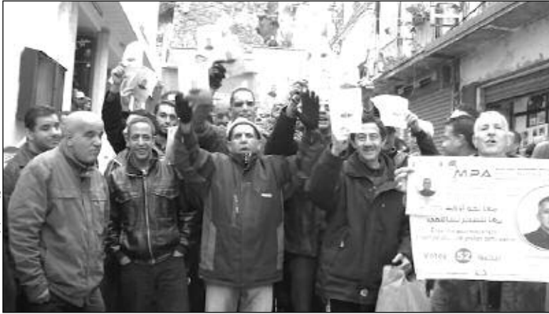
زايد يدي أفتيس

عرفت العديد من البلديات عبر الوطن احتجاجات وتدمرات بعد الإعلان عن نتائج الانتخابات المحلية، والشروع في الدخول في تحالفات بين المنتخبين، ورفض ما أسموه ببيع أصواتهم لأشخاص لم يختاروهم في الصندوق، كما أعلنوا رفضهم لطريقة تنصيب الأميار. في حين لا تزال الأمور غامضة في بلديات أخرى.