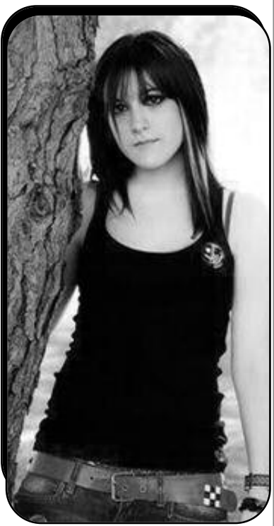
سيدتي.. بالمختصر المفيد أنا فتاة أحب شابا وعدني بالزواج، وقد كان خلال كل المدة التي جمعتني به مثالا للعب والهيام، حيث إنني وثقت فيه ثقة عمياء، لدرجة أنني منحتة

سيدتي بعد التحية والسلام، اسمحي لي أن أحييك على المجهودات الجبارة التي تقومين بها في سبيل تنوير دروب الحيارى والمحرومين مثلي إلى من يأخذ بيدهم؛ ولعل هذا ما دفعني إلى أن أرسلك حتى أعرف طريقا للخلاص مما أنا فيه.