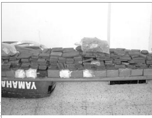
مخدرات من الكيف

تمكنت مصالح الجمارك في ورقلة بالتنسيق مع أفراد الجيش الشعبي الوطني للناحية العسكرية الرابعة، نهاية الأسبوع، من الإطاحة بأكثر بارون مخدرات.