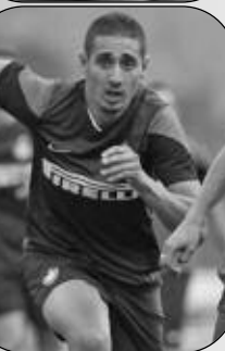
مارتشييلو ليبي: «بلقوصيل يملك المهوبة واللقب يقتصر على عمل ماتزاري»

أشاد المدرب الإيطالي المتك مارتشييلو ليبي بالمهاجم الجزائري إسحاق بلقوصيل، حيث اعتبره صاحب مهوبة في حوار له مع الصحيفة الإيطالية الشهيرة لاغازيت ديوسبور، حيث قال: «بلقوصيل وإيكاردي لديهما المهوبة لكن الأنتر أكثر من ذلك، هاندانوفيتش حارس من الطراز العالي وإذا عاد ميليتو إلى مستواه فستكون هناك أهداف كثيرة، لكن اللقب يقتصر على عمل المدرب ماتزاري».