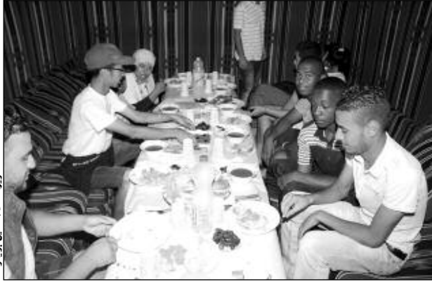
توزيع المواد الغذائية على المحتاجين