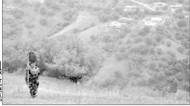
تسليم المواد الغذائية لقاطنو قرية «تيزة ناث أخداش» في البويرة

ما زالت معاناة المواطنين متواصلة مع رحلات الحصول على قارورات غاز البوتان من القرى المجاورة، ويتعدّد الأمر أكثر مع حلول فصل الشتاء، أين تشهد هذه المادة الحيوية ندرة حادة في هذه الفترة، مما يجبر أغلبية السكان على اللجوء إلى استعمال الحطب للتدفئة والطهي وهو الشيء الذي انعكس سلبا على الثروة الغابية في المنطقة، ويضاف إلى هذا المشكل، حسب إدرات المتحدثين لـ «النهار»، نقائص أخرى تتمثل في نقص المشاريع التنموية التي من شأنها إعطاء دفع لإخراج المنطقة من دائرة العزلة والحرمان والتهميش على غرار التهيئة والتموين بالمياه الصالحة للشرب، حيث إن القرية لاتزال تتخبط في أزمة عطش منذ الاستقلال إلى يومنا هذا، أين يعتمد سكانها على اقتناء الصهاريج وجلب المادة الحيوية من مختلف المنابع المتفرقة هنا وهناك، والتي تعرف