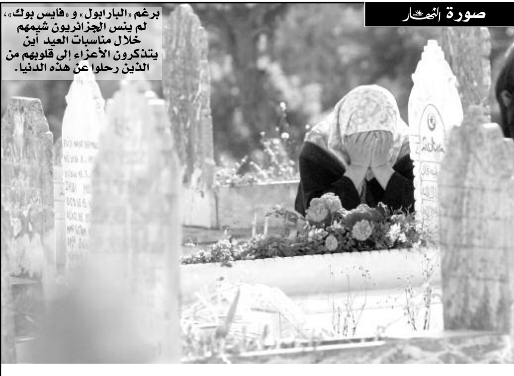
برغم «البارابول» و «فايس بوك»، لم ينس الجزائريون شيمهم خلال مناسبات العيد أين يتذكرون الأعمام إلى قلوبهم من الذين رحلوا عن هذه الدنيا.

وجد وزير النقل عمار غول نفسه مجبرا على الصراخ في وجه القائمين على محطة «الخروبة» للنقل البري خلال زيارة العمل والتفقد التي قادته إلى عدد من مشاريع قطاعه في العاصمة. ويبدو أن سياسة «العوج» التي أرهقت المواطنين الجزائريين الذين يستقلون الحافلات إلى مختلف ولايات الوطن قد أقلقت وزير النقل عمار غول كثيرا، حيث راح يطالب بوقفها «فورا» قبل أن يفجر غضبه ويهدد بمعاينة المسؤولين على المهزلة التي تعيشها المحطة.