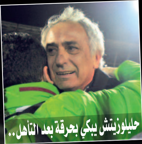
حليوزيتش يكي بحرقه بعد التأهل..

بفوضيل: «نهدي هذا التأهل إلى الرئيس بوتفليقة ورسالته حفرتنا كثيرا»