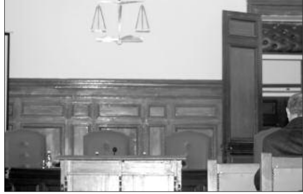
«ساكوشي أوتو»، ليطالب وكيل الجمهورية بتسليط عقوبة عام حسبا نافذا ضد المتهم.

أنكر ما نسب إليه، وأكد أن لا علاقة تربطه بالجرم المنسوب إليه، مشيراً إلى أن كل معاملات كانت مع شركة