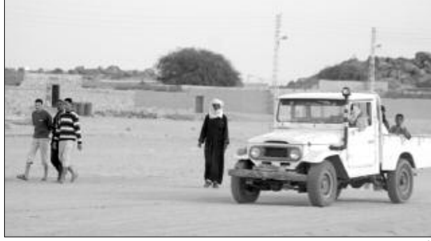
أعطاب سياراتهم، نقص في المرافق الترفيهية والثقافية

أضاف قاطنو القرية، أن هذه الأخيرة تعاني من نقص ملحوظ في المرافق والهيكل الشبابية، والثقافية، والترفيهية المجهزة، التي من شأنها استقطاب المواهب الشبابية، حيث صرح لنا بعض الشباب، أن هذا النقص أضحى يؤثر عليهم وينعّص عليهم حياتهم، خاصة مع معاناتهم من شبح البطالة والخوف من ولوجهم عالم المخدرات والانحرافات، التي تؤدي إلى ما لا يُحمد عقباه. كما تشكو القرية من افتقارها إلى قاعات أنترنت، لما توفره من معلومات علمية وتربوية وترفيهية. كارثة إيكولوجية تهدد قاطني القرية