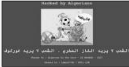
الفتح ٢ بريمة الغاز الصخري - الفصاح ٢ بريمة غوركيف

غوركيف الذي سيتولى الإشراف على المعارضة التقنية للخضر بداية من شهر أوت المقبل، قيام الهاكرز بمثل هذه العملية جاء للضغط على هيئة ورواية بعد التفريط في خدمات التقني البوسني الذي قدم الكثير للمنتخب الوطني، ودليل ذلك بلوغهم الدور الثاني من المونديال لأول مرة في تاريخ الكرة الجزائرية، ورفضاً للمدرب الفرنسي لنادي لوريان والذي يعتبرونه أقل قيمة