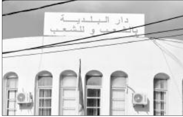
على حساب البلدية لدى الخزينة العمومية الأسبوع الماضي من أجل اقتطاع المبلغ من حساب البلدية مباشرة. هذه الوضعية

أفاد أعضاء المجلس الشعبي البلدي لبلدية عين العراك الواقعة عبر الطريق الوطني رقم 47 الرابط ولاية البيض بولاية الجنوب الغربي، أن ورثة شخص متوفى تحصلوا على حكم نهائي من مجلس قضاء سعيدة بداية الشهر، يقضي بتسديد مبلغ مالي بما يقارب 40 مليار سنتيم قيمة الأراضي الملكية للورثة التي بنيت عليها البلدية بأكملها منها مرافق عمومية ومقر البلدية وأكثر من ألفي قطعة أرض باعها المجالس الشعبية المتعاقبة على البلدية منذ الاستقلال.