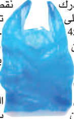
نقص كبير في عدد الأكياس المنتجة، وقد تم متابعة العمال بكاميرات المراقبة، حيث اتضح بأن هناك حركة غير عادية في آخر ساعات الليل، ليتبين بأنهم يقومون بسرقة الأكياس وتحويلها مباشرة إلى خارج المصنع لبيعها، وخلال تقديم المشتبه فيهم أمام وكيل الجمهورية لدى محكمة الحجار، أمر بوضعهم تحت الرقابة القضائية عن تهمة تكوين جماعة أشرار والسرقه بتوفر ظروف الليل والتعدد وخيانة الأمانة. صله بن سيدهم

تمكنت أمس، عناصر الفرقة الإقليمية للدرك الوطني في «البوني» بعنابة، من القبض على خمسة أشخاص تتراوح أعمارهم بين 25 و45 سنة، تورطوا في سرقة عدد كبير من الأكياس البلاستيكية الجديدة من الشركة التي يعملون فيها، والواقعة على مستوى منطقة «السرول» في «البوني». وحسب ما أوضحته مصادر مؤكدة لـ «النهار»، فإن السارقين يستغلون فترة عملهم ليلا ويقومون بسرقة الأكياس البلاستيكية التي يتم صنعها في تلك الفترة، أين تقطن عمال المراقبة إلى وجود