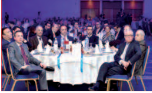
للنشاطات والتظاهرات السنوية Ooredoo الشريك الرسمي للمنتدى. للتذكير، كان للملتقى الاقتصادي الذي نُظّم

من طرف منتدى رؤساء المؤسسات و«الميدف» الدولي (MEDEF-International) في إطار اجتماع اللجنة الحكومية المختلطة رفيعة المستوى، الذي نُقّد في الجزائر شهر ديسمبر 2013. ومن خلال رعايته لمختلف لقاءات منتدى رؤساء المؤسسات، يُعبر Ooredoo عن إرادته في ترقية فضاءات التبادل بين المتعاملين الاقتصاديين الناشطين في مختلف القطاعات.