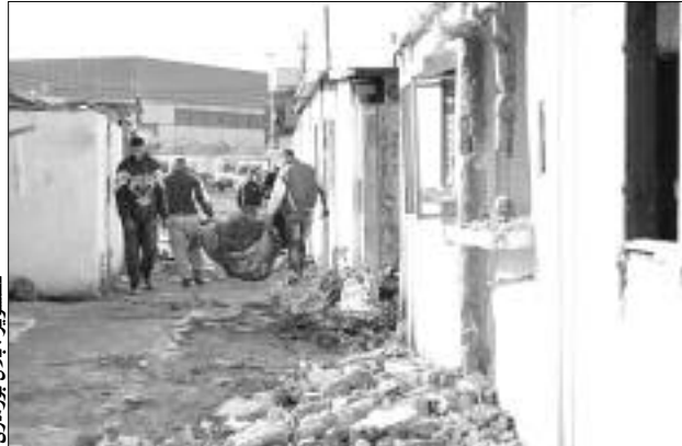
تجمع براقفي بولاية الجزائر

وأقدمت العائلات المعنية، صبيحة أمس، بإغلاق الطريق الرابط بين الرايس والأربعاء ببراقي، حيث طالبت بفتح تحقيق في عملية الترحيل التي قامت بها لجنة الدائرة الإدارية المختصة في دراسة ملفات العائلات المعنية على مستوى دائرة براقفي، كما طالب ممثلو العائلات بضرورة إيفاد لجنة ولائية للتحقيق في عملية الترحيل، كما أكد ممثلو العائلات في حديثهم لـ «النهار» بأنهم يقطنون حي ديار البركة قبل الاستقلال، ولم يستفيدوا طيلة هذه الفترة من أي دعم أو مساكن من الدولة، مؤكداً بأن اللجنة المشرفة على