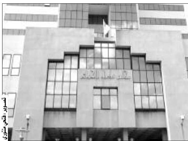
تصوير قضي منطوي

تابعت، أمس، محكمة الحراش رعية سوريا تاجرا متزوجا وأبا لطيفين بتهمة التزوير واستعمال المزور في جواز سفر سوري محل بحث الأنتربول. المتهم السوري المستفيد من إجراءات الاستدعاء المباشر، حوّل على وكيل الجمهورية لدى محكمة الحراش بعد توقيفه على مستوى المطار الدولي هواري بومدين بالجزائر العاصمة، ويحوزته جواز سفر مسروق مبلغ عنه من طرف السلطات السورية. الرعية السورية مثل، أمس، أمام هيئة المحكمة وأنكر تزويره للجواز، مشيرا إلى أنه وبعد تدهور