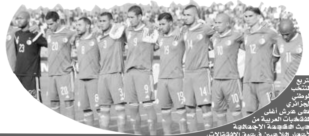
بترع المنتخب الوطني الجزائري هتلى هرش أعلى المشجعين العربية من حيث الشهرة الإجمالية لأشهر لاعبين في سوق الانتقالات،

حيث بلغت القيمة السوقية الإجمالية للخضر 83 مليون جنيه إسترليني، ما يعادل أكثر من 115 مليون أورو ويقارب 1300 مليار سنتيم بالعملة الجزائرية، حسب القيمة السوقية التي بعدها موقع «ترانسفر ماركيت» الإنجليزي المتخصص في سوق انتقالات اللاعبين، أسعارهم، وقيمة البطولات والكؤوس العالمية. في حين حل المنتخب المغربي ثانيا بقيمة 67 مليون جنيه إسترليني، يليه المنتخب المصري في المركز الثالث بقيمة سوقية إجمالية بلغت 36 مليون جنيه إسترليني.