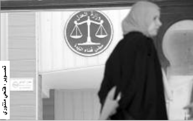
القاضي - منوري

أجمع رؤساء ومدیرو المؤسسات العمومية الذين أدلوا بشهادتهم في قضية الخليفة، أول أمس الخميس، على أن الإغراءات التي حملتها نسبة الفوائد المرتفعة ببنك الخليفة دفعتهم لإيداع أموال المؤسسات بهذا البنك الخاص، وأثار القاضي عترة منور تساؤلات حول تزامن انخفاض نسبة الفوائد بالبنوك العمومية بعد أن وصلت إلى 5 و 4 وحتى 2 من المائة مع ظهور بنك الخليفة، وطرحه لنسبة فوائد مغرية وصلت إلى 12 من المائة.