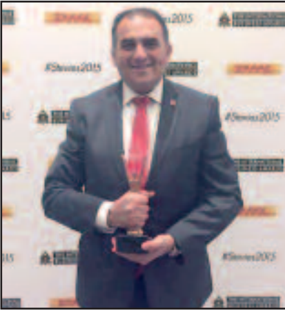
المواصلة في تشريف الجزائر على الصعيدين الجهوي والعالمي.