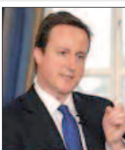
بريطانيا تجبر الشركات على نشر تفاصيل المرتبات لمعالجة الفجوة بين الجنسين

قالت الحكومة البريطانية، أمس الأحد، إنها ستعزز محاولاتها لمعالجة الفجوة بين المرتبات بين الجنسين، من خلال إجبار الشركات الكبيرة على نشر تفاصيل العلاوات التي تمنحها للرجال والنساء. وفي جويلية قال رئيس الوزراء البريطاني، ديفيد كامرون، إن الشركات الكبيرة ستكون ملزمة بكشف المعلومات المتعلقة بحجم المرتبات التي تدفعها للرجال بالمقارنة مع النساء، وبدء تشاور -انتهى الشهر الماضي- بشأن كيفية وضع الإجراءات الجديدة. وقالت الحكومة