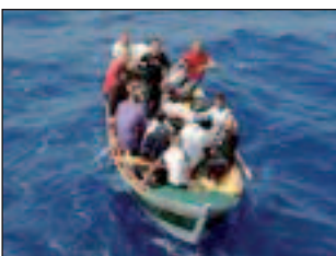
الجزر اليونانية على متن زوارق مطاطية مكتظة في أغلب الأحيان. وتمكن أكثر من نصف مليون شخص أغلبهم فارون من الحرب الأهلية في سوريا من الوصول إلى اليونان عبر هذه الرحلة في طريقهم إلى وسط وشمال أوروبا.

قالت السلطات اليونانية إن امرأة وطفلين غرقوا عندما اصطدم زورق مطاطي يحمل 63 مهاجراً بصخور قبالة جزيرة ليسبوس اليونانية، أمس الأحد. وقالت متحدثة باسم خفر السواحل إن سبعة أشخاص مازالوا مفقودين، وتمكن الباقون من الوصول بأمان إلى اليابسة ولم تعرف جنسياتهم بعد. وقد لقي عشرات اللاجئين حتفهم، في الشهور الأخيرة، بينهم الكثير من الأطفال وهم يحاولون القيام برحلة قصيرة محفوفة بالمخاطر من تركيا إلى الجزر اليونانية على متن زوارق مطاطية مكتظة في أغلب الأحيان. وتمكن أكثر من نصف مليون شخص أغلبهم فارون من الحرب الأهلية في سوريا من الوصول إلى اليونان عبر هذه الرحلة في طريقهم إلى وسط وشمال أوروبا. ومن المفروض أن، جان كلود يونكر، رئيس المفوضية الأوروبية، التقى أمس الأحد، مع قادة من وسط وشرق أوروبا من أجل الاتفاق على أسلوب لمواجهة تدفق اللاجئين قبل دخول الشتاء.