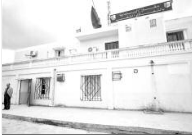
بالأحوال وأكوام الحجارة والنفايات التي أصبحت مصدر قلق مثير للمخاوف ومهدد للصحة. ودائما حسب مصادرنا،

من جملة الانشغالات التي مازالت تؤرق هؤلاء السكان، الافتقار لشبكة غاز المدينة رغم مرور الأنبوب الرئيسي على بعد أمتار قليلة فقط عنها، الأمر الذي أثار استياءهم وعمّق معاناتهم مع قارورات الغاز في منطقة تميزها قساوة الطبيعة صيفا وشتاء، ونفس الواقع المتردي تعرفه قاعة العلاج التي تفتقر بدورها إلى التجهيزات لإسعاف المرضى والمصابين قبل تحويلهم إلى المستشفى، وتتواصل مظاهر الغبن داخل شوارعها وطرقاتها المغطاة