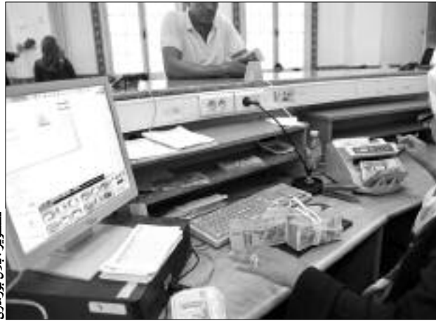
توقيف بريد الجزائر

الاختلاس حساب إحدى زميلاته في العمل لتحويل الأموال المتلاعب بها، المتهم الثاني أشار إلى أنه أقحم في القضية نظرا لحسن نيته في مساعدة زميله، وأنه لم يكن يعلم من أي حساب تم التحويل منه سوى التأثير بأن الحوالة من بريد الجزائر في قسنطينة، المتورط الرئيسي في القضية اعترف خلال جلسة المحاكمة بكل ما اقترفه، مصرحا أن الضغوطات والظروف القاسية التي مرّ بها هي ما دفعه لهذه الحيلة التي لم تكلف مؤسسة بريد الجزائر أي خسائر ولا حتى الضحايا الذين تم تعويضهم في مستحققاتهم كاملة. من جهته، التمس ممثل الحق العام تسليط عقوبة 7 سنوات حسبا نافذا ومليون دج غرامة مالية نافذة، في حين طالب بدفع المؤسسة المتضررة تعويضا ماديا قدره 200 مليون سنتيم.