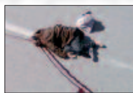
عجيلة بالأغواط، فيما فتحت مصالح الشرطة تحقيقا في

وقع، يوم الخميس، حادث مرور أليم على مستوى الطريق الوطني رقم واحد في مدينة الأغواط أسفل النفق السفلي، وأدى الحادث إلى وفاة شخص كان يهر راكبا أسفل النفق صدمته سيارة من نوع «سبارك» بيضاء. الضحية نقل ميتا إلى مستشفى أمعيدة بن وقع، يوم الخميس، حادث مرور أليم على مستوى الطريق الوطني رقم واحد في مدينة الأغواط أسفل النفق السفلي، وأدى الحادث إلى وفاة شخص كان يهر راكبا أسفل النفق صدمته سيارة من نوع «سبارك» بيضاء. الضحية نقل ميتا إلى مستشفى أمعيدة بن