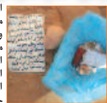
المتورطين في هذه الأعمال الشيطانية وإحالتهم مباشرة نحو أروقة العدالة، وحسب المعطيات المتوفرة فإن الحملة ستطال بقية المقابر المتواجدة بإقليم الولاية.

قامت يومي الأربعاء والخميس، جمعيات تشغل على مستوى المجتمع المحلي بمدينة ورقلة رفقة متطوعين، في حملة تنظيف واسعة من أجل تطهير القبور من الأوساخ وكذا من أعمال السحرة والمشعوذين والمشعوذات الذين ينسجون حرمة الأموات، وقد مست المبادرة الأولى مقبرة بني ثور، أين تم العثور على مجموعة من تائم وحرور، مكتوب عليها أسماء بواسطة الدم، ناهيك عن صور تعود لشباب وعليها أفعال مدفونة وسط القبور وبعض الأدوات المستعملة في