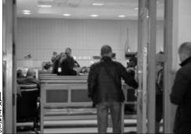
مجلس قضاء بومرداس يبرهن على أن المتهمين بالاحتيال على المواطنين

أفادت مصادر مقربة لـ«النهار»، أن غرفة الاتهام لدى مجلس قضاء بومرداس برمجت ملفا خاصا بالنصب والاحتيال على محكمة الجنايات، بعد إنهاء التحقيق مع عناصر العصابة التي يقودها إطار مزيف بإدارة الجمارك، عملوا على استغلال المواطنين بواسطة طرق احتيالية، حيث وصل عدد الضحايا إلى أكثر من 20 شخصا كلهم شباب، في حين بلغت عائدات العمليات أكثر من مليار و 20 مليون سنتيم، حسب ما أسفر عنه التحقيق.