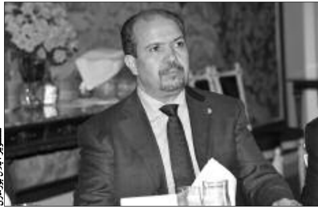
محمد عيسى وزير الشؤون الدينية والأوقاف

كشف وزير الشؤون الدينية والأوقاف، محمد عيسى، عن وجود محاولات حقيقية بولايتين على الحدود الشرقية والغربية من قبل دول غير إسلامية لزرع أفكار دخيلة وصناعة أقليات باسم الدين لزعزعة الاستقرار الوطني، كما أكد محمد عيسى أن اتفاقية «سيادو» تتعارض والقيم الدينية الوطنية ولا يمكن أن يتم تطبيق بنودها في المجتمع الإسلامي الراض مثل هذه المنظمات الدخيلة.