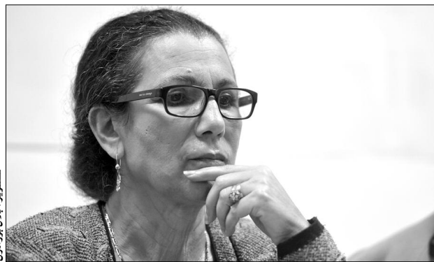
تسجيل بلال كباش

أحد النواب البرلمانيين وقام بالتقليل إلى ولاية عنابة للمتقاضي حول ممتلكات وعقارات عائلة حنون المتواجدة بين ولاية عنابة والطارف، واتصل بجميع الأطراف هاتفيا ليكون ملما أكثر بالموضوع، حيث كلف شقيقها هاتفيا واعترف له بحقيقة ممتلكاتهم، على خلاف ما قالته حنون إنه قام باستفزاز في المكالمة، مضيفا أنها قامت بعقد ندوة صحفية وقامت من خلالها بتقيد ما ورد في المقال من دون أن تمارس حق الرد الذي يخولها لها القانون، وعليه التمسست النيابة تغريم جريدة التحرير بصفتها شخصا معنويا إلى جانب الزميل بصفته شخصا طبيعيا بمبلغ 50 ألف دج. والجدير بالذكر، أن لوزية حنون ظلت برواق المحكمة إلى حين انطلاق جلسة المحاكمة، متفادية الاختلاط بباقي المتقاضين.