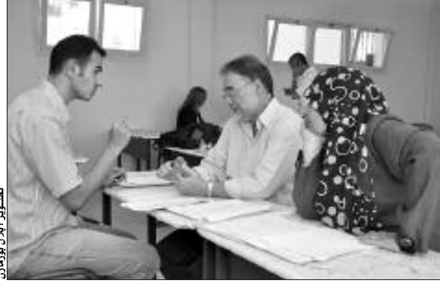
تسيير، بالبلد بوزمان

راسلت مديرية التكوين على مستوى وزارة التربية، مديريات التربية والزمتهم بالشروع في عمليات التكوين التي تخص الأساتذة الناجحين في مسابقات التوظيف الأخيرة، والذين سيلتحقون بالطور التعليمية الثلاثة مع بداية الدخول المدرسي شهر سبتمبر المقبل. وحسب المعلومات المتوفرة، فإن عملية التكوين سيشرف عليها مفتشو التربية والتعليم الابتدائي، كما يركز التكوين على ثلاثة محاور أساسية، تتمثل في التسيير البيداغوجي والتسيير الإداري والتشريع المدرسي، ويأتي هذا التكوين على مستوى الوزارة الوصية، قصد تنظيم علاقات العمل داخل المؤسسات وتلقين الأساتذة الجدد أيجدييات التدريس الحديث، أين تؤخذ