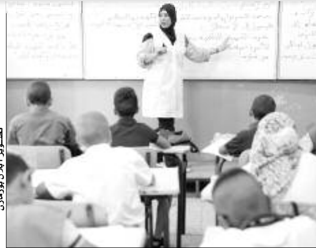
تلميذ يشرح لزملائه في فصل دراسي.

تدعم قطاع التربية، هذه السنة، حسب المديرية، غنيمية آيت إبراهيم، بعدة منشآت مدرسية من شأنها الرفع من طاقة الاستيعاب في المقاعد البيداغوجية وتخفيف الضغط عن المؤسسات التي كانت تعاني في السنوات الفارطة، إضافة إلى القضاء على ظاهرة العمل بنظام الدوامين، وهذا باستلام 3 مجمعات مدرسية جديدة بالبلدية وبنى مراد والإرعاء، في انتظار استلام 3 مجمعات مدرسية أخرى بكل من حي برقوق وحي 3555 مسكن بمفتاح وتعيوض مدرسة شريفي محمد المتضررة من جراء الزلزال بمقطع لزرق بحمام ملوان، واستلام