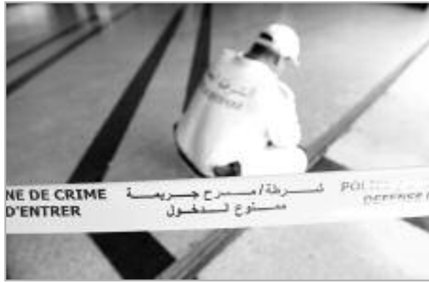
غادر السجن لم يكن يتصور أن أسواره أهون من طعنتي خنجر قاتلتين، وأن السجن لسنتين أو ثلاثة أحسن من الحرية لـ15 يوما فقط. وفي تفاصيل