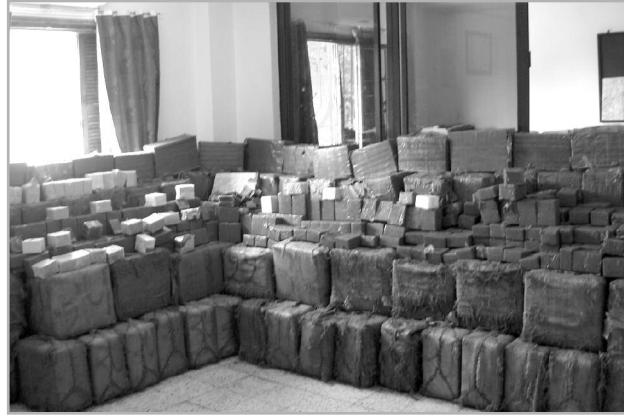
على صلة بالعملية الأولى، وبعد تشديد الرقابة على الطرقات والسيارات شرق غرب، ضبطت

جمارك أولاد الميمون شرق تلمسان على الطريق السريع سيارة من نوع «بيجو 205» تابعة لوكالة كراء، وبتفتيش ركابها تم العثور على قرابة كيلوغرام بحوزتهم، فيما حجزت جمارك هنين رطلاً من المخدرات بعد اعتراض طريق سيارة كراء من نوع «سامبول»، وقدرت مراجع «النهار» القيمة الإجمالية للسموم المضبوطة بما يفوق ملياري سنتيم، أين تم توقيف عدد من المهريين تبعاً لهذه العمليات، قبل تسليمهم لفصيلة الأبحاث للدرك الوطني للتحقيق معهم حول مصدر المحجوزات ووجهتها.