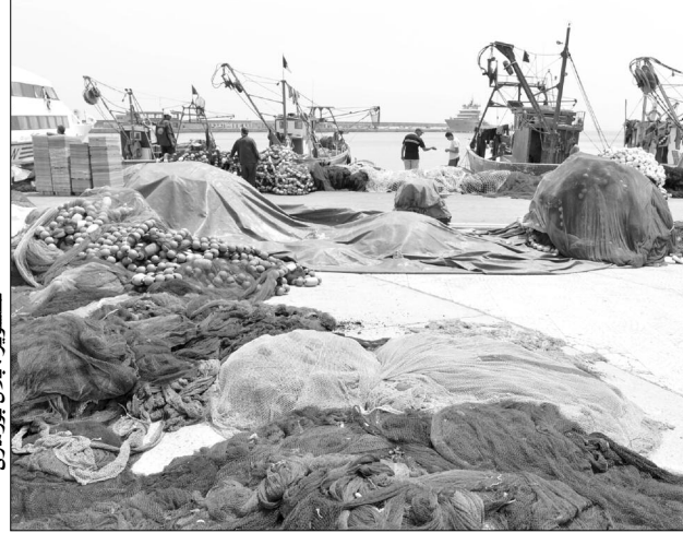
صيايد ميناء زموري ينتظرون الثروة السمكية

طرحوا المشكلة مشكل غلق مدخل الميناء قبل عدة أسابيع بسبب مشكل الترميل الذي تسببت فيه الاضطرابات الجوية الأخيرة، مما أعاق عملية دخول وخروج السفن، إلى جانب الضيق الشديد الذي أضحى يعرفه الميناء بسبب رسو سفن تعود لأشخاص غير معروفين بالمنطقة، وهذا لعدة سنوات، واستفادة أشخاص من سفن صيد في إطار وكالة «أوناسج» ويقائنها في الميناء من دون نشاط. واقترح محدثونا من البحارة أن تقوم الوزارة بتمكينهم من أجرة شهرية خاصة بفترات البطالة على الأقل تمكنهم من اقتناء مادتي الحليب والخبر لأطفالهم. أما عن مشكل الترميل، فقد أكد والي الولاية في آخر زيارة له إلى الميناء الأسبوع الفارط أنه أعطى تعليمات صارمة بهدف رفع ما يقارب 17 ألف متر مكعب من الرمال من مدخل الميناء بعد تعيين مؤسسة تابعة لقطاع النقل «مي دي ترام» ستقوم برفع الرمال في مدة شهرين كاملين، مما يمكن الصيادين بعدها من العودة ومزاولة نشاطهم، في انتظار التفتاة من وزارة القطاع لما يزيد عن 1400 بحري فقط بميناء زموري من دون ذكر مینائی کاب جنات ودلس.