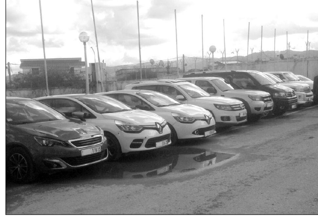
سيارات نفعية من نوع «سامبول» و«سانديرو»، لتتمكن العصابة من الحصول على عدد من السيارات

وحسبما أورد مصدر «النهار» من معلومات، فإن أفراد الشبكة تم إحالتهم على التحقيق القضائي بمحكمة سيدي امحمد بعدما كيفها قاضي التحقيق على أساس جنائية لخطورة حيثياتها، إلا أن غرفة الاتهام أعادت التكيف إلى جناحة تكوين جماعة أشرار والسرقة بالتعدد، إذ كشفت تصريحات المتهمين في التحقيق أن وقائع القضية انطلقت عام 2016، عندما تم التخطيط لسرقة سيارات مستأجرة من وكالات كراء سيارات، ويجدر بالذكر أن هذه الأخيرة كانت متعاقدة مع وكالة دعم وتشغيل الشباب في شراء