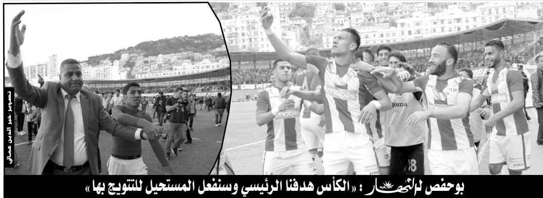
بوخص لالتصنار: «الكأس هدفنا الرئيسي وسنفل المستحيل للتتويج بها»