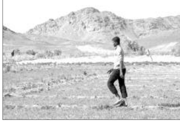
أقربو عبد القادر

تعاني أغلب بلديات ولاية إيزي من مشكل الاستيلاء على الأوعية العقارية من طرف مواطنين، مما أعاق تجسيد عدد من البرامج العمومية، بينها مرافق وتجهيزات عمومية وحتى برامج سكنية، وتعرف ظاهرة الاستيلاء العشوائي على العقار العمومي امتدادا على مستوى مختلف بلديات الولاية، لكنها تعتبر أكثر انتشارا في بلديات أكثر من غيرها.