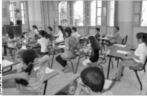
تلاميذ يترقبون نتائج الاختبارات

خالفت العديد من المؤسسات التربوية قرار وزيرة التربية الوطنية، نورية بن غبريت، القاضي بتوحيد اختبارات الفصول الثلاثة، أين قام بعض المديرين بإجراء اختبارات الفصل الثالث بالنسبة للسنتين الأولى والثانية ثانوي في السابح ماي الماضي، علما أن الوزارة حددت تاريخ 28 من شهر ماي كتاريخ موحد لإجرائها. وشددت الوزارة من خلال مراسلتها على ضرورة تسليط عقوبات صارمة على المديرين المخالفين، حيث سيتم تحويلهم إلى المجالس التأديبية، وسيتم