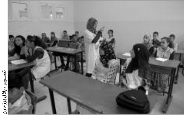
تلاميذ يدرسون في فصل دراسي

وذكرت الوزيرة بأنه وتحسبا للدخول المدرسي 2017-2018، فقد وضع الديوان الوطني للمطبوعات المدرسية تحت تصرف التلاميذ 30 كتابا مدرسيا جديدا و6 كراريس للتلاميذ تخص الطورين الثانيتين من التعليم الابتدائي والمتوسط (السنين 1-3 والثالثة والرابعة ابتدائي والثانية والثالثة متوسط)، وهذا استكمالاً للتحسينات في المناهج التربوية التي انطلقت السنة الماضية.