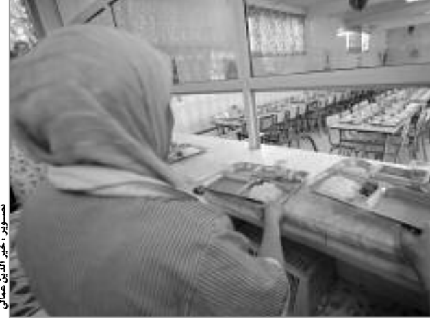
العمال المكلفين بالمطبخ في المطاعم المدرسية

كما استنجدت عدة بلديات في ولاية البويرة بحراس الليل وعمال النظافة وحتى معلمين، قصد إطعام التلاميذ في العديد من المدارس، التي خرجت من دائرة اهتمام المسؤولين المحليين ببعض المدارس، خاصة بعد غلق مزيد من 30 مطعما بعدة بلديات خلال الموسم الفارط لنقص التموين، في حين تشهد بعض المؤسسات التربوية بالمقاطعة