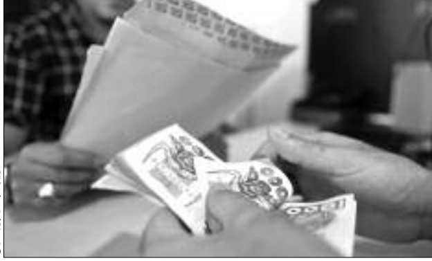
تحويل بـ 20 مليون سنتيم