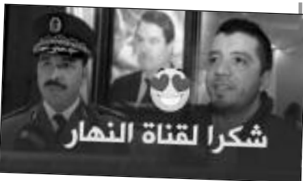
شكرا لقناة النهار

كرّمت مصالح أمن ولاية قسنطينة قناة «النهار»، بمناسبة الاحتفال باليوم العربي للشرطة الذي يصادف الـ 18 ديسمبر من كل سنة، وجاء التكريم اعترافا بالمجهودات التي يبذلها مجع «النهار» الرائد، والاحترافية التي تميّزه في خدمة الوطن والمواطن، من خلال إيصال صوت المواطنين إلى المسؤولين ونقل الأخبار التي تهمهم، سواء داخل الوطن أو خارجه.