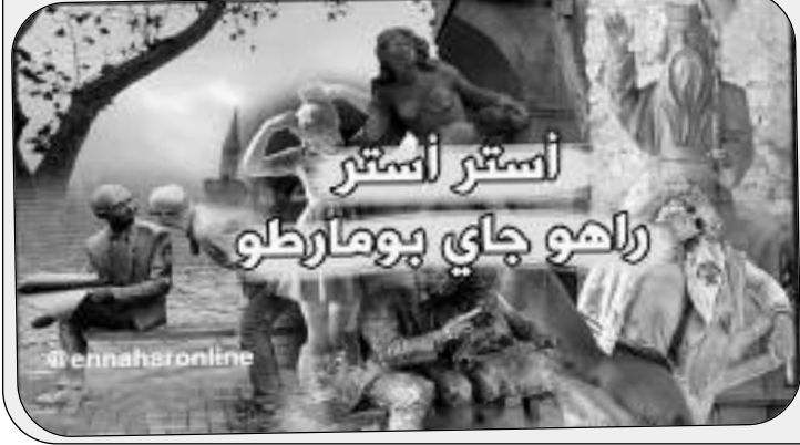
أستتر أستتر راهو جاي بومارطو