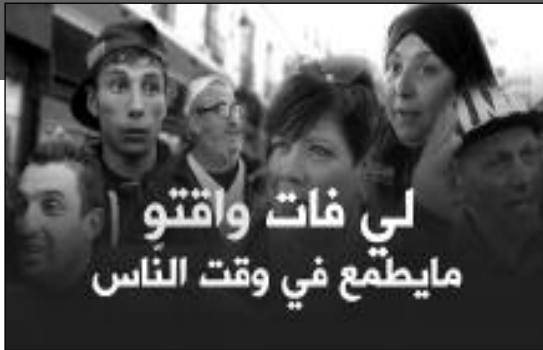
لي فات واقتو مايطمع في وقت الناس

وقد ارتأى برنامج «صريح جدا» التنقل إلى بعض شوارع العاصمة لرصد آراء الجزائريين حول الموضوع، حيث أجمع أغلبهم على أن الظاهرة أخذت منحى آخر في حياة الجزائريين، بداية بطريقة اللباس إلى الحديث وغيرهما.