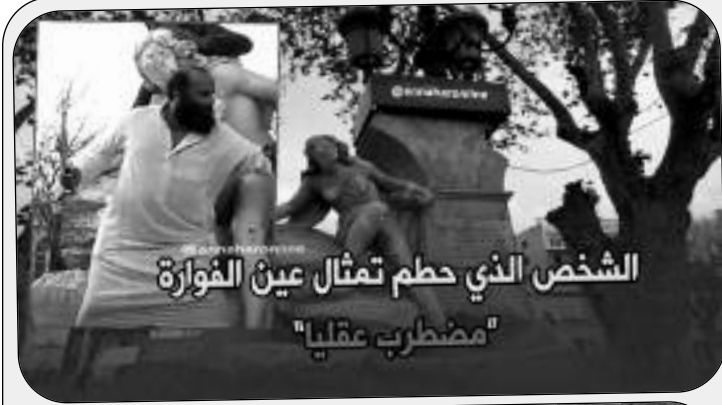
الشخص الذي حطم تمثال عين الفوارة "مضطرب عقليا"