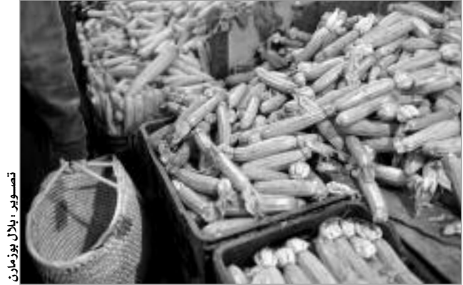
تسيير أجورهم إلى غاية 20 يوما، فيما أكدت أن 14.5 من العاملين يستطيعون إكمال الشهر بأجرتهم.

بيّنت الدراسة التي شملت أغلب ولايات الوطن، أن 45.5 من العاملين لا يدوم أجرهم لـ 10 أيام، فيما يستطيع 40 من المئة من العاملين