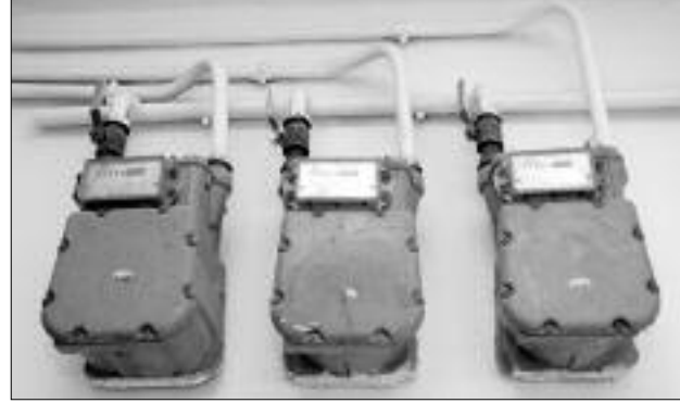
المقلقة والمتدهورة لهذا الحي الذي يبقى خارج اهتمام وأجندة المسؤولين بأدرار خطرا حقيقيا يهدد حياة السكان، لاسيما الأطفال

والذين راح أحدهم ضحية لهذا الوضع المتفاقم، نهار أول أمس، بعدما قطعت الكلاب الضالة جسده البريء، والذين يدفعون ثمن هذه الوضعية التي لم تتدخل السلطات ولا الهيئات والمصالح المعنية من أجل إيجاد حلول لعلاجها والتخفيف على الأقل من معاناتهم بتوصيل الكهرباء إلى منازلهم كغيرهم من باقي السكان. يذكر في هذا السياق أن هذا الحي لا يبعد سوى كيلومترين اثنين عن مقر الولاية، ولكنه ورغم ذلك يبقى خارج خارطة المسؤولين والمنتخبين منذ عدة سنوات وإلى يومنا هذا.