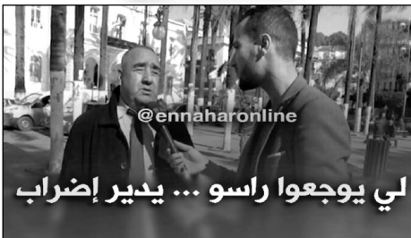
لي يوجعوا راسو... يدير إضراب

تطرق برنامج «صريح جدا» الذي يبث على قناة «النهار»، إلى موضوع الإضرابات التي شهدتها عدة قطاعات خلال الأشهر الأخيرة، حيث رصدت «كاميرا» البرنامج عدة آراء لمواطنين حول هذه الإضرابات التي أدت إلى شل عدة قطاعات، أين أبدى المواطنون تدمرهم واستياءهم من ذلك، لكونها تعطل قضاء حوائجهم من جهة، وتؤثر على الاقتصاد الوطني من جهة أخرى، كما طالبوا بضرورة إيجاد حلول في أقرب وقت ممكن.