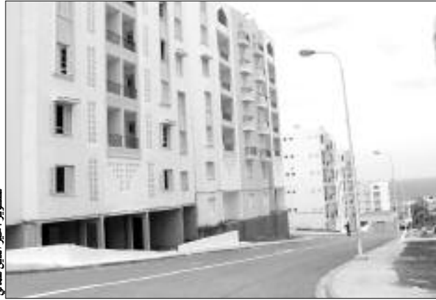
مساكن جاهزة تنتظر التوزيع

البير وقرابية والعراقيل الإدارية، تخوف المسؤولين والتهرب من مواجهة المواطنين، الربط بالغاز والكهرباء، هي أسباب مباشرة وغير مباشرة ساهمت في قضاء آلاف العائلات الشتاء عديدة تحت أسقف هشة وأخرى من قصدير، رغم أنهم مستحقون أو مستفيدون من مساكن جاهزة تنتظر التوزيع منذ أكثر من سنتين.