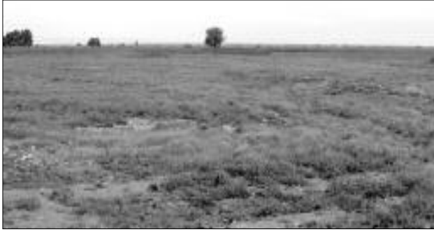
في إطار تطهير العقار الفلاحي على مستوى الولاية على الفلاحين تم تسجيل 19 ألف هكتار من أصل 300

وأوضح المسؤول الأول عن الجهاز التنفيذي، أن ملف تطهير العقار الصناعي يوشك على الانتهاء، مشيرا إلى أنه تم إحالة ملفات 15 مستثمرا أمام المحاكم المختصة إقليميا، كما ستقوم الوكالة العقارية هي الأخرى بإحالة ملفات المستثمرين المتقاعسين أمام العدالة من أجل استرجاع جميع الأوعية المسوقة غير المستغلة. وأشار نفس المسؤول إلى أنه تم إحصاء 4 آلاف هكتار من الأراضي غير المستغلة، حيث سيتم تشكيل لجنة ولائية من أجل توزيع الأراضي الفلاحية التي تم استرجاعها