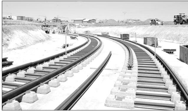
شبكة السكك الحديدية تتعرض للسرقة بشكل يومي

وفي سياق آخر، أوضح محدثنا أن أهم المشاكل التي تعاني منها شبكة النقل بالسكك الحديدية، وهي تعرضها لعدة اعتداءات منها البنائيات الفوضوية والهشة على طول السكة، لاسيما على مستوى بني مراد والشقة، وكذا بنائيات داخل المرافق الخاصة بالشركة الوطنية للنقل