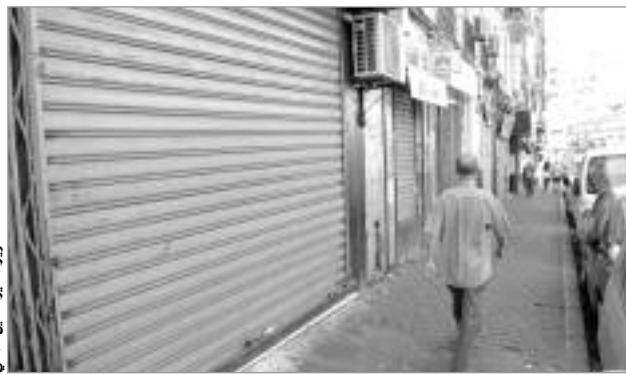
الطماطم بـ120 دينار والبطاطا بـ70 دينار

شهد اليوم الأول من أيام عيد الفطر المبارك، انقطاعات متكررة في التزود بالمياه الشروب عبر عدة بلديات، كما رفض عديد التجار والناقلين التجاوب مع نظام المداومة التي فرضتها وزارتا التجارة والنقل، حيث دخل الجزائريون في رحلة بحث عن المواد واسعة الاستهلاك، على غرار الخبز والحليب. بعدما أشر أغلب التجار غلق أبواب محلاتهم والاحتفال بيوم العيد.