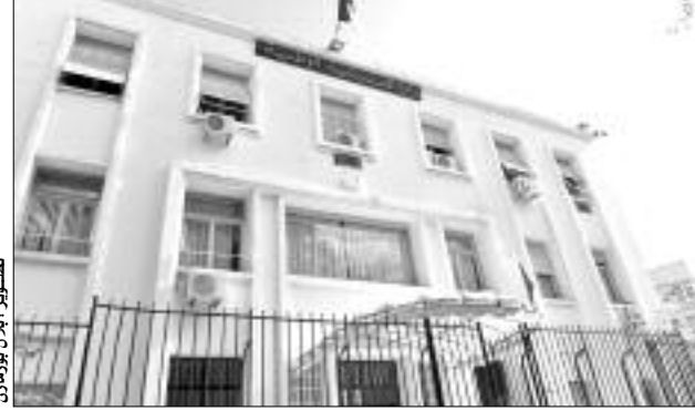
مترشحون لامتحان مسابقة التوظيف الخاصة بأساتذة التعليم الابتدائي وسلك الإدارة.

وحسب التعليم التي وزعتها المفتشية العامة للبيداغوجيا على مديريات التربية الموزعة عبر التراب الوطني، فإن أسئلة المسابقة الشفهية ستكون مثل أسئلة المسابقة الكتابية، يحضرها مفتشون تحت إشراف المفتشية العامة للبيداغوجيا، ويتكلف الديوان الوطني للامتحانات والمسابقات بطبعها