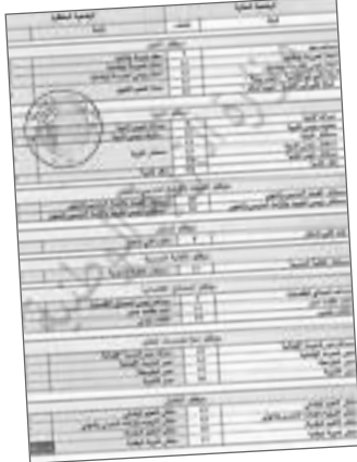
السلام 14 إلى 16.

رفع التصنيف إلى رتبة ناظر ثانوية من 14 إلى 16 ومستشاري التربية من 13 إلى 15