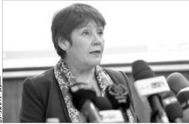
نورية بن غبريت

وأبرزت بأن البلديات تعد الجهة المسؤولة عن تسيير المطاعم المدرسية منذ الاستقلال، وأشارت إلى أن تسجيل الاعتمادات المخصصة من الدولة لتسيير المطاعم المدرسية تندرج ضمن ميزانية التسيير للوزارة المكلفة