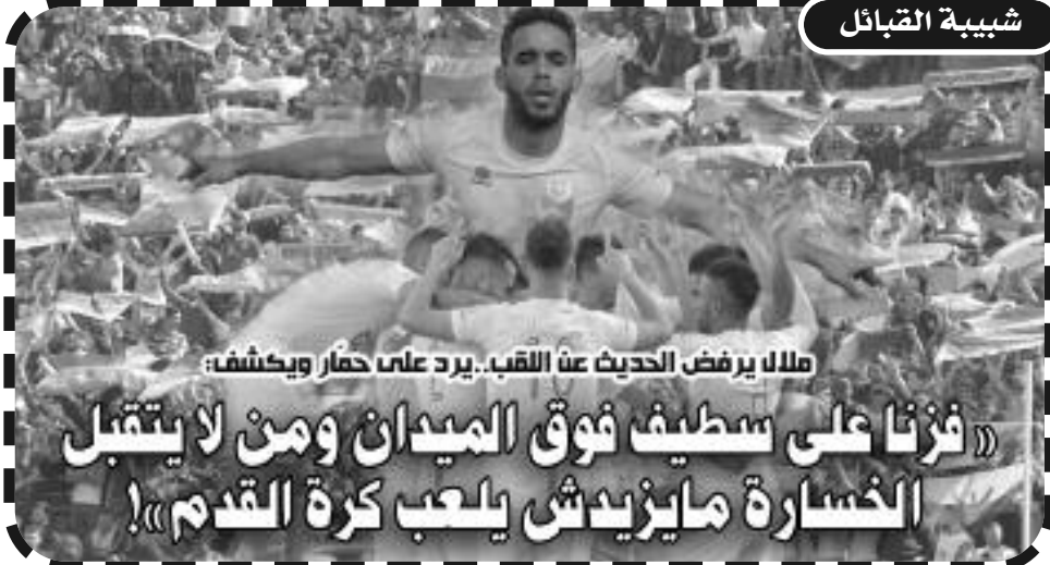
ملال يرفض الحديث عن اللقب.. يرد على حمار ويكشف:

«فرزنا على سطيف فوق الميدان ومن لا يتقبل الخسارة ما يزيدش يلعب كرة القدم»!