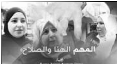
المهم الهنا والصلاح

تطرق برنامج «صريح جدا» الذي يبث على قناة «النهار»، في عدد جديد، إلى موضوع اجتماعي يتمثل في معرفة إن كانت المرأة الجزائرية تقبل الزواج من رجل فقير، بشرط أن يكون إنسانا صالحا، حيث أجمعت النساء اللواتي اقتربت منهن عدسة تلفزيون «النهار» التي جابت عددا من شوارع العاصمة، بأنهن يقبلن الزواج من رجل فقير، حيث اعتبرن بأن الله هو الغني وهو الرزاق.