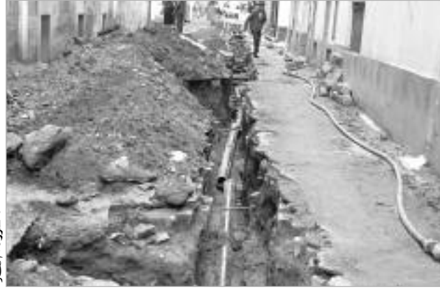
من الأسقف المهترئة، بالإضافة إلى غرق الطوابق الأرضية في المياه وطريقة بلاط المساكن

وكشفت لقطات وصور وقفت عندها «النهار»، حقيقة الغش في إنجاز هذه المساكن التي تتسرب إليها السيول