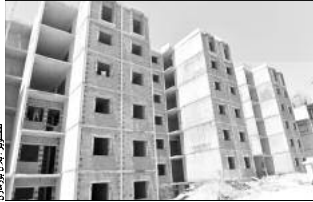
مبنى سكني قيد الإنجاز في بويرة

تم تسجيل 12 سنة من التأخر الخاص بـ130 مسكن تساهمي تابع لقطاع التربية، و50 مسكنا تساهميا يتنازوت شرق الولاية و109 بأمشدة و22 بسور الغزلان، إلى جانب مشاريع «عدل» في سور الغزلان والأخضرية وعين بسام، بالإضافة إلى 2938 مسكن اجتماعي متوقف ومسجل في البرنامج الخامس 2010-2014، وأزيد من 1016 وحدة من مختلف الصيغ، منها «عدل» والسكن المدعم، بعدة بلديات، وأزيد من 6 آلاف مسكن، منها المدعم و«عدل» لم تنطلق بها الأشغال، رغم حلول سنة 2019. وقد أرجعت اللجنة الأسباب الخاصة