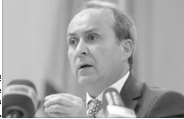
مختار حسبلاوي وزير الصحة والسكان وإصلاح المستشفيات

هذا وكشف حسبلاوي، أنه تم تخصيص حوالي 63 مليار دينار في