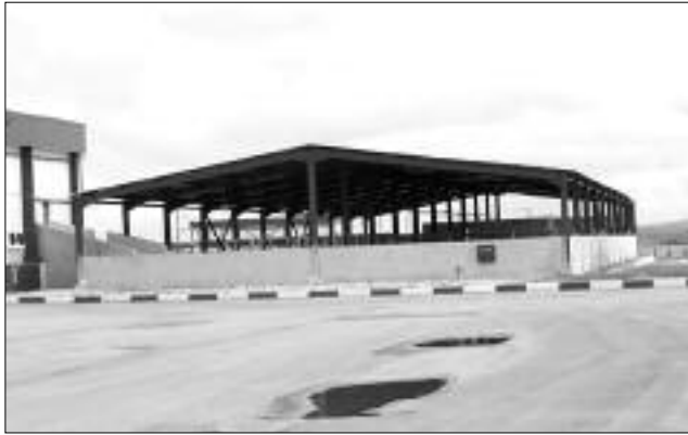
حي المجاهدين مساحة 50 هكتارا و243 قطعة، وبلدية المنصورة و243 هكتارا و243 قطعة بالمدخل الشمالي للمدينة بمساحة 50 هكتارا و243 قطعة وبلدية

حاسي لفحل بالمدخل الشمالي بمساحة 50 هكتارا و243 قطعة. وينتظر أن تحتضن هذه المناطق 1628 نشاطا صناعيا جديد في إطار الاستثمار، وهو عدد معتبر وضخم بإضافة المشاريع الاستثمارية التي تمت الموافقة عليها خارج مناطق التسهيلات المقدمة من طرف الوالي، الذي دعا في العديد من الخرجات كل المستثمرين الجادين إلى التقرب إلى مصالحيه والاستفادة من كل التسهيلات المقدمة في هذا الشأن، في إطار منح العقار الصناعي وتسهيل الإجراءات الإدارية.