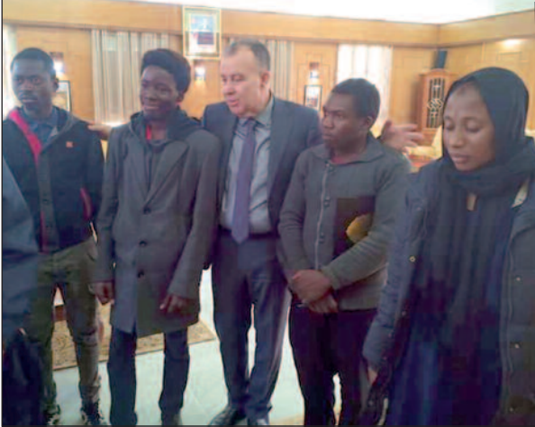
على اليمين صورة الطالب المغدور وفي اليسار صورة والي عنابة برفقة أصدقاء الضحية