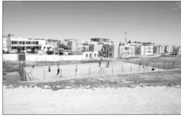
ملاعب مماثلة على مستوى باقي الأحياء الأخرى بذات البلدي. وفي سياق ذي صلة، رصد مبلغ مادي بقيمة مليوني دج لإنجاز

وقد تم تسطير برنامج عملي لإنجاز هذه المشاريع، حيث سيتم في هذا الإطار إنجاز ملعب واحد بكل من وسط مدينة برج عمر إدريس والثاني بالتجمع السكني تيفاتي وأخر بالتجمع السكني زاوية سيدي موسى، وهي المنشآت الرياضية المرتقبة التي ستساهم في ترقية النشاط الرياضي بهذه المناطق، هذا وسيتم إطلاق ورشات تلك الملاعب الجوارية فور الانتهاء من الإجراءات الإدارية الخاصة بها واختيار مقاولي الإنجاز، حيث ينتظر كذلك إنجاز