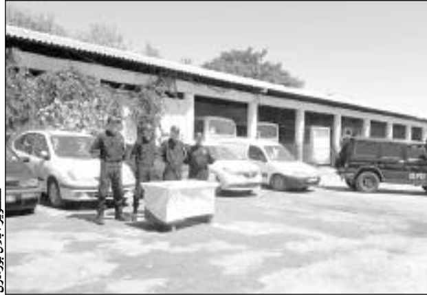
تحويل بطلان المركبات

حين، أكد الأمين العام، أن توقعه على الملفات القاعدية المزورة الخاصة بالسيارات المهربة، هو توقيع شكلي فقط، وهذا بعد توقيع الكاتبة ورئيس المصلحة. أما البطلان الـ 17، فقد صرحوا للقاضي الجزائري أن المتهمين الموقوفين استغلوا الصعوبة ليعرضوا عليهم إيداع الملفات القاعدية بأسمائهم مقابل مبالغ مالية تراوحت بين 15 و20 ألف دج، وفي المقابل، أنكر المتهمون الستة الجرم المنسوب إليهم، محاولين التملص من المسؤولية الجزائية من خلال تحميل المسؤولية لباقي المتهمين، ليتمسوا في الأخير بإفادتهم بالبراءة، أما الضحايا، فقد تمسوا بقبول تأسسهم طرفا مدنيا في القضية، مع إلزام المتهمين بإرجاع سياراتهم ودفع تعويض تراوحت قيمته بين 20 و 50 مليون سنتيم. وعلى أساس ما تقدم من معطيات، التمس ممثل الحق العام لدى محكمة الشرافة، توقيع عقوبة السجن النافذ لمدة 7 سنوات في حق السماسة الستة، أما بقية المتهمين، فقد التمس ضدهم عقوبة الحبس النافذ لمدة 3 سنوات.