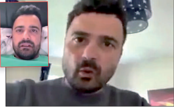
جنوب شرق لندن، بتهمة التهديد بالاعتداء بالحمض على النساء اللاتي قد تُشارك في المظاهرات للمطالبة

وانتشر فيديو آخر لنفس الشخص وهو يعتذر عن التصريحات والتهديدات التي أدلى بها عبر المقطع برمى النساء الجزائريات بـ «الأسيد» في المسيرات، ورغم الاعتذار الذي قدمه الجزائري المقيم ببريطانيا للجزائريين، إلا أن الشرطة باعتقالها للشخص تكون قد أثبتت أنها لن تتسامح في هذه الحالات.